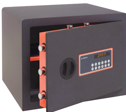
PLUS-C Τύπος 180150